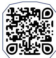
دائلود بروشور جشنواره