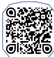
دانلود کلیپ جشنواره