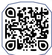
دانلود بروشور جشنواره