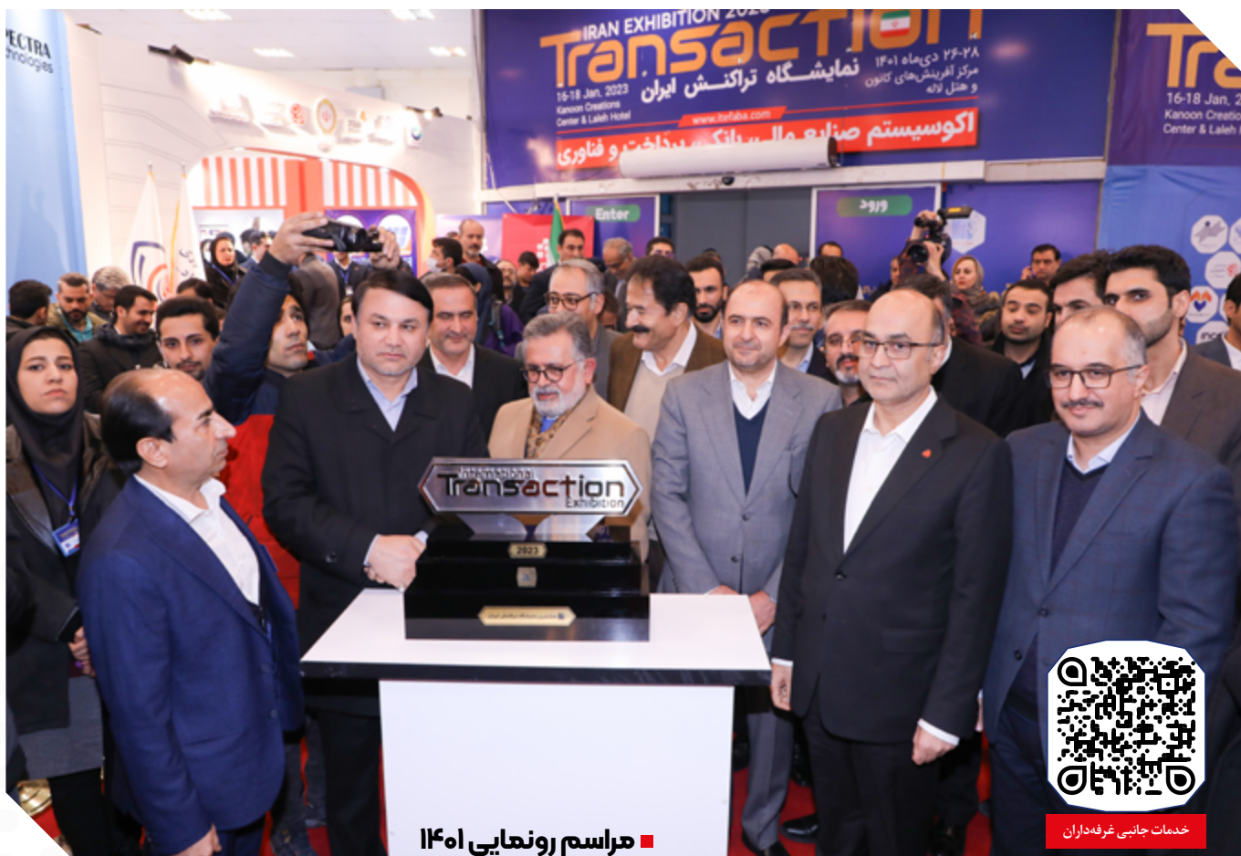
مراسم رونمایی ۱۴۰۲